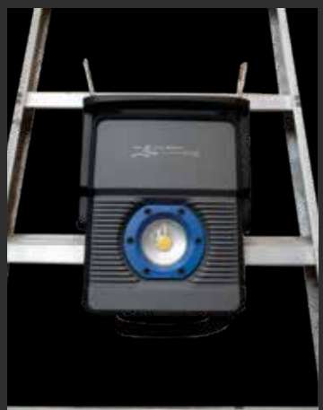
Kuke za vješanje