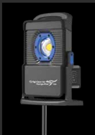
Montaža na tronožac (5 + 10K modela)