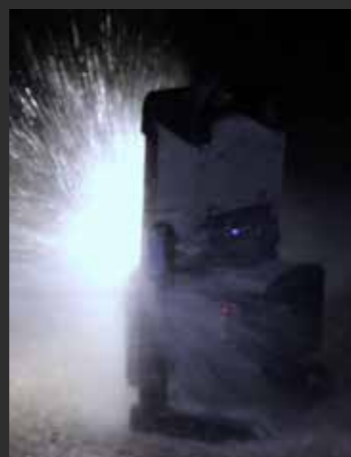
IP65 ocijenjeno aluminijsko kućište otporno na udarce