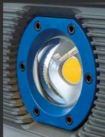
Konveksna leća Poboljšana svjetlosna zraka